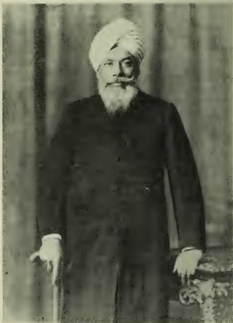
डॉ. बा. शि. मुंजे